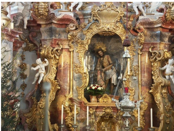
Fot. Ołtarz główny, figura Chrystusa w sanktuarium w Wies